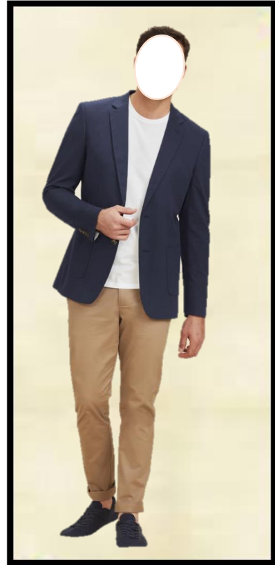
2. SUIT BECORAK DAN BERKASUT SUKAN