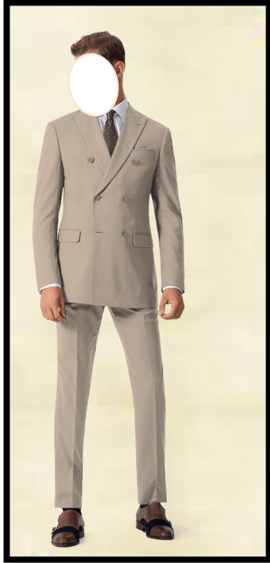
1. DOUBLE BREASTED SUIT